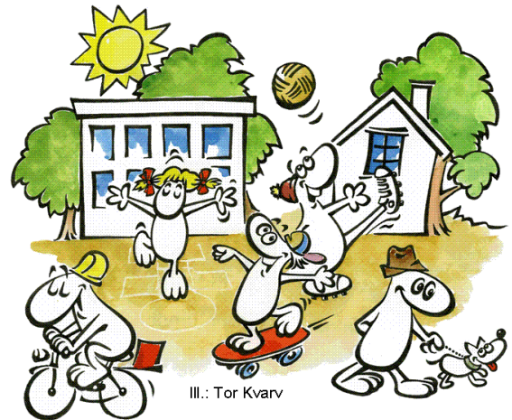
Ill.: Tor Kvarv